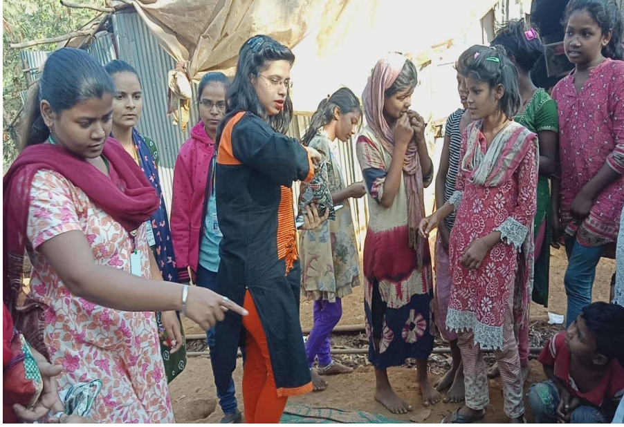
Cleanliness Drive by DLLE Students:-